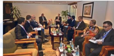
Menhub Bahas Peningkatan Kerjasama Dengan Delegasi Inggris dan Polandia dephub.go.id